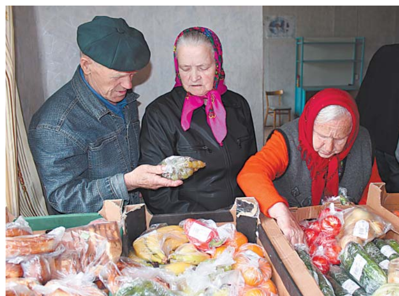
В очереди за продуктами