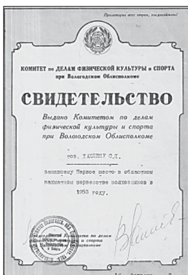
Свидетельство о победе в областном турнире шахматистов