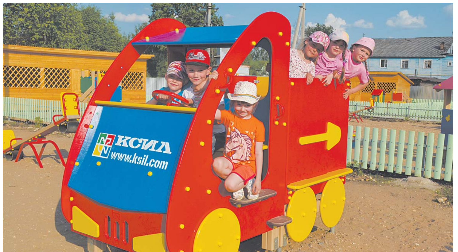
Ребята из старшей группы детского сада №2 «Солнышко» с удовольствием гуляют на новой площадке

Подготовили Ольга Гулина и Наталья Соломатова