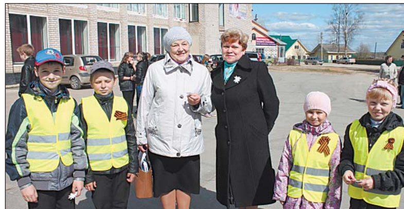
Перед 9 Мая ребята из отряда «Зебра» раздавали прохожим светоотражатели

Проект редакции при поддержке Управления информационной политики правительства Вологодской области