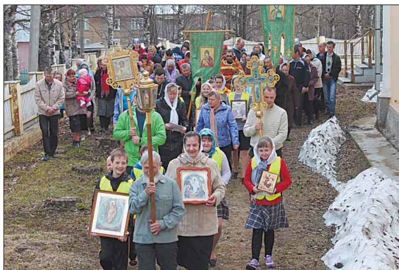
Юидовцы приняли участие в крестном ходе